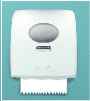
Scott® Control™ Système d'essuie-mains en rouleau

Tous nos distributeurs sont garantis à vie pour accroître votre confiance dans nos solutions d'hygiène pour les sanitaires.