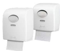
Distributeur d'essuie-mains en rouleau Aquarius™