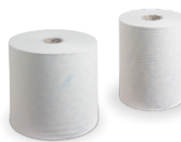
Essuie-mains en rouleau Scott® Control™