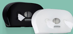
Distributeur de Scott® Control™ Mini Twin à dévidage central 7186 / 7187 (Noir)