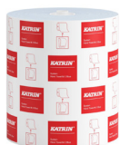
460263 Katrin System Käsipyyherulla M 2-kerroksinen, Sininen