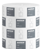
57795 Katrin Plus System Käsipyyherulla M 2-kerroksinen