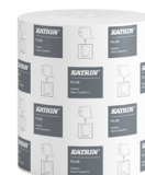
460058 Katrin Plus System Käsipyyherulla M 2-kerroksinen