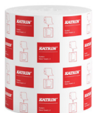
460232 Katrin System Käsipyyherulla L 2-kerroksinen

Kansainvälinen valikoima. Markkinakohtainen saatavuus löytyy tuotesivuilta.