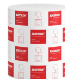
58198 Katrin System Käsipyyherulla M 2-kerroksinen