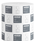
82537 Katrin Plus System Käsipyyherulla M 2-kerroksinen