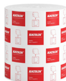
460102 Katrin System Käsipyyherulla M 2-kerroksinen