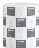
38015 Katrin Plus System Käsipyyherulla M 3-kerroksinen