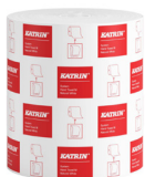
460201 Katrin System Käsipyyherulla M 1-kerroksinen, Luonnonvalkoinen