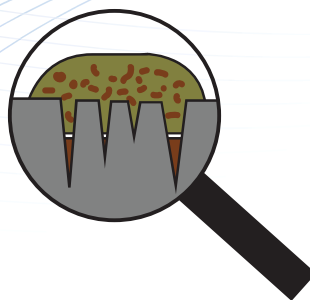
Kostutus "perinteisillä" puhdistusaineilla.