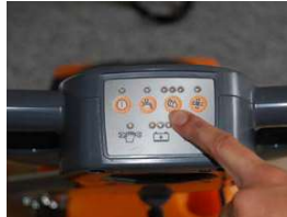
9. Säädä pesuliukoksen määrä, 3 asentoa (pisara-symbolit)