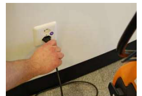
25. Kytke latauslaitteen liitäntäjohto pistorasiaan

HUOMIOITAVA! Älä käytä konetta ennenkuin olet lukenut ja ymmärtänyt koneen käyttöohjeet!