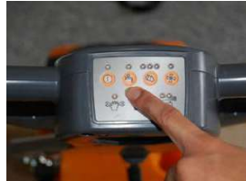
8. Käynnistä veden tulo