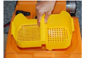
15. Irrota karkean lian kori ja puhdista se juoksevalla vedellä