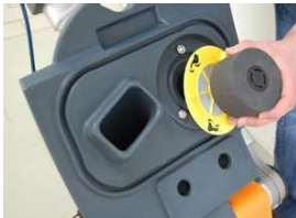
17. Irrota ja puhdista ylitäyttösuoja ja imuilman suodatin