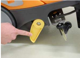
6. Vapauta pysäköintituki