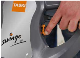
12. Voit asettaa varren vapaasti liikkuvaksi, paina oranssia lukitsinta