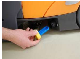
18. Tyhjennä puhtasvesisäiliö ja puhdista puhtasvesisuodatin