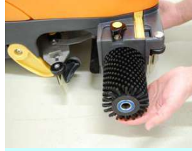
3. Laita harja paikalleen