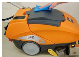
23. Puhdista koneen ulkopinnat kostutetulla siivouspyyhkeellä