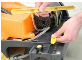
22. Puhdista vesisuuttimet jaksottain