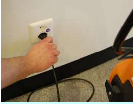
1. Irrota latauslaitteen liitäntäjohto pistorasiasta