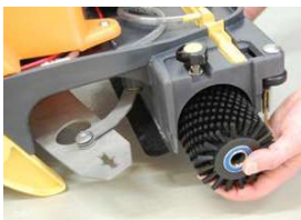
21. Irrota ja puhdista harja