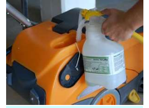
5. tai täytä säiliö Diversey annostelujärjestelmällä