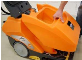
16. Tyhjennä ja puhdista likavesisäiliö