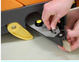
2. Kiinnitä imu-suulake