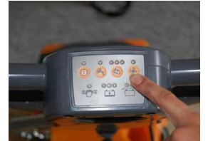
10. Käynnistä imumoottori