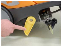
19. Laita kone pysäköintituen varaan