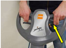
11. Säädä varren korkeus