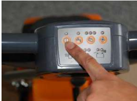
7. Käynnistä kone painamalla käynnistyspainiketta 3 sekuntia