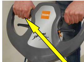
13. Käynnistä harjamoottori käynnistyskytkimistä ja aloita pesu