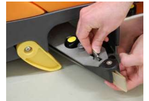
20. Irrota ja puhdista imu-suulake