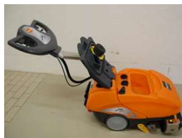
24. Säilytä konetta säiliön kannet avattuina ja pysäköintituen varassa